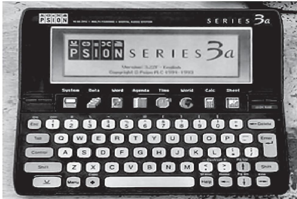
चित्र 1 – PSION व्यक्तिगत आयोजक